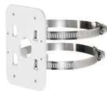
PFA152 Dispositif de montage sur mât